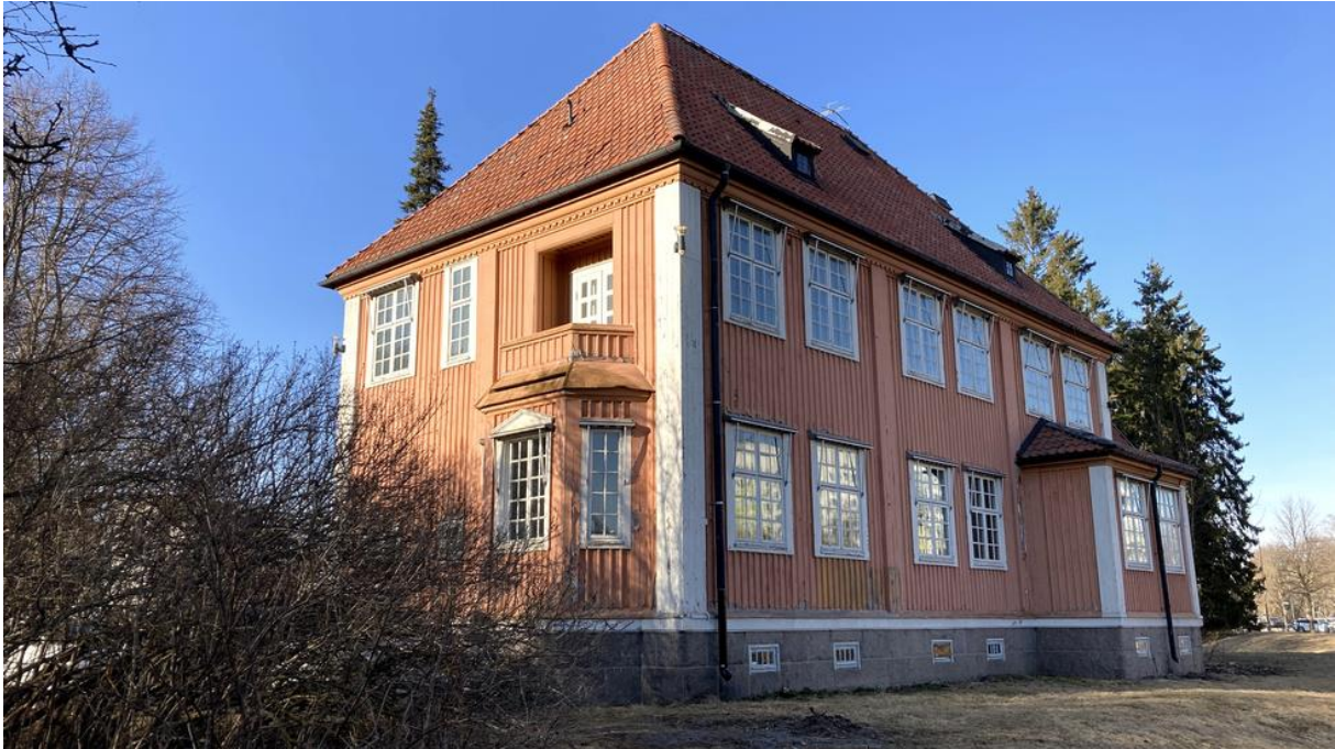
Rektorsvillan ska förmodligen bli en enda stor bostad, eller fem till sex lägenheter enligt Bonava.

De största och ståtligaste husen är den förra rektorsbostaden och vaktmästarbostaden från tiden när lärarutbildningen bedrevs i seminariebyggnaden. Läget, mitt i den stora parken, är unikt och det är ingen vågad gissning att prislappen kommer att vara hög.